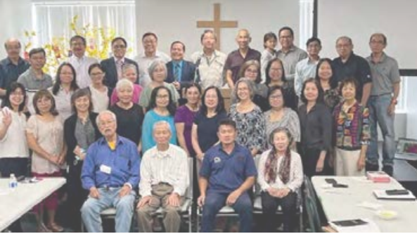
Hội Thánh Mississauga, Ontario, Canada