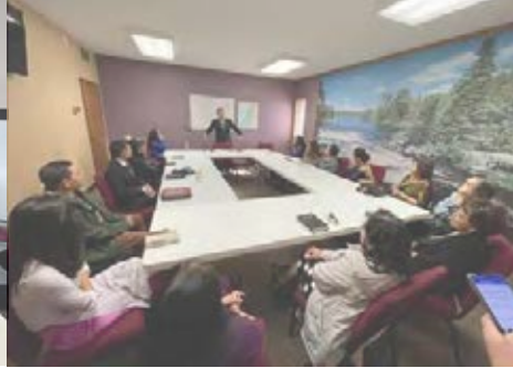
Hội Thánh St. Paul, Minnesota