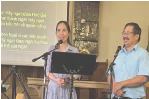
Hội Thánh Hamilton, Hamilton, Canada