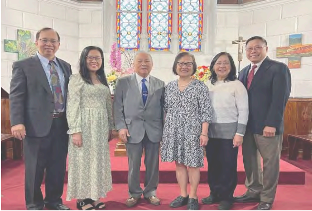
Hội Thánh Tin Lành Paris, Paris, France